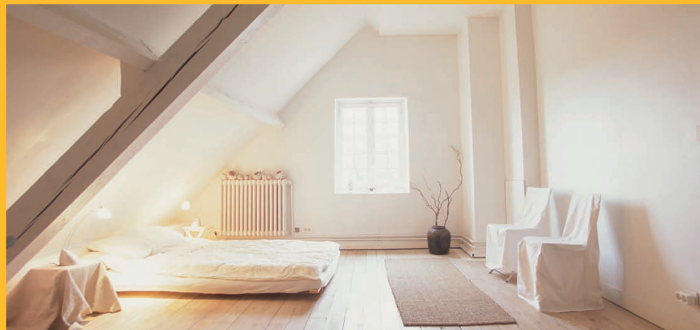
Ytong® je registrirana robna marka Xella grupe.

Ytong je čuvar skupocjene energije! Smanjuje troškove prilikom grijanja i hlađenja Vašeg stambenog prostora.